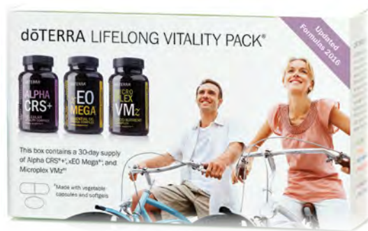
dōTERRA LIFELONG VITALITY PACK™ NAHRUNGSERGÄNZUNG MIT ALPHA CRS™+, MICROPLEX VMZ™ UND xEO MEGA™