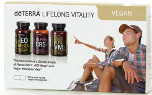
dōTERRA LIFELONG VITALITY VEGAN PACK™ NAHRUNGSERGÄNZUNG MIT ALPHA CRS™+, MICROPLEX VMZ™ UND vEO MEGA™